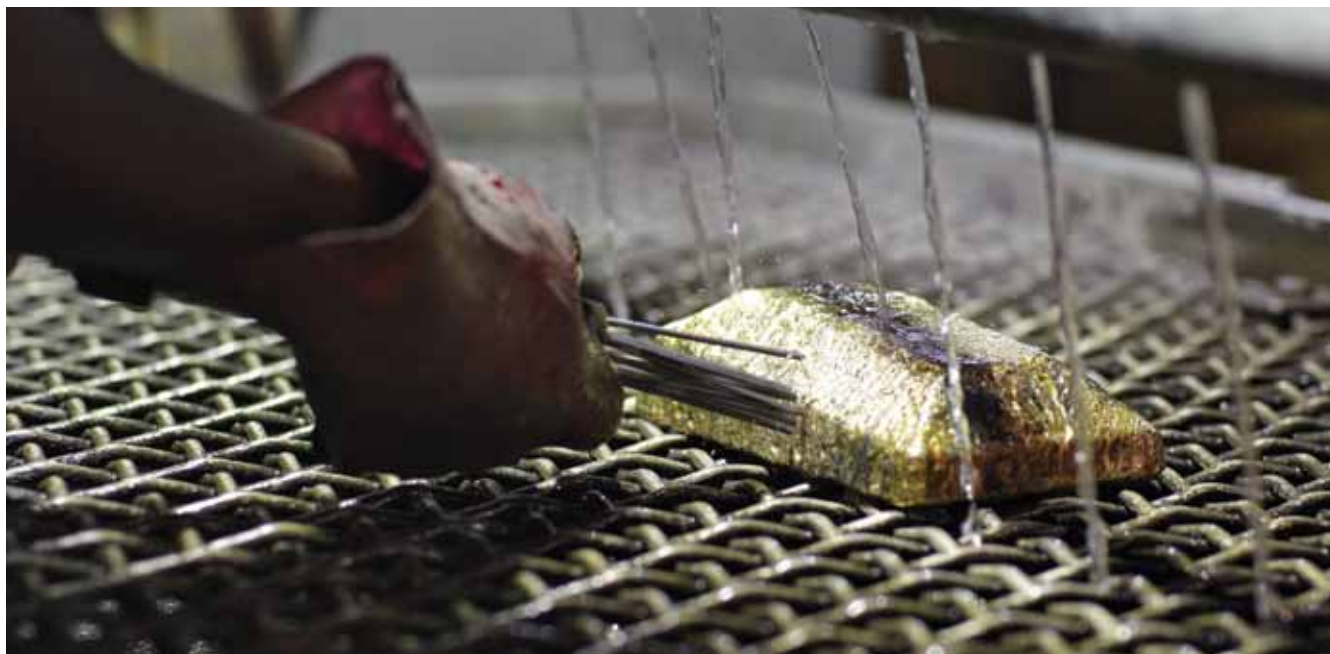
Limpiando una barra de oro doré.

La Unión Europea , dentro del contexto de su trabajo general sobre el comercio, el desarrollo y la política de materias primas, ha declarado su intención de generar propuestas para mejorar la trazabilidad de los minerales.